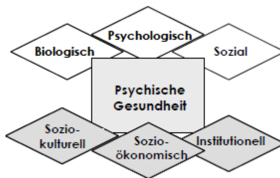
Abbildung 2: Determinanten Psychischer Gesundheit 8

Psychische Gesundheit ist das Resultat komplexer dynamischer Interaktionen zwischen biologischen, psychologischen, sozio-ökonomischen, sozio-kulturellen und institutionellen Faktoren.